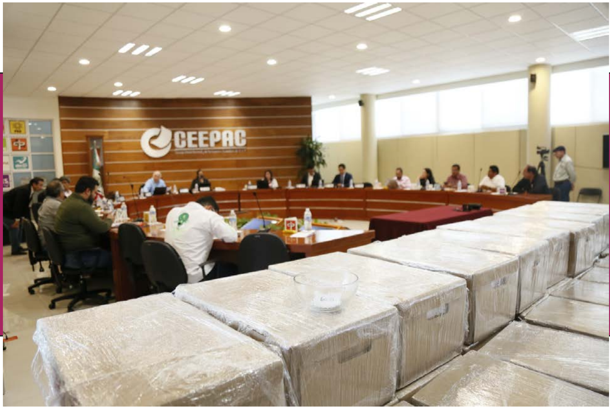
Integrantes del Consejo General del CEEPAC.