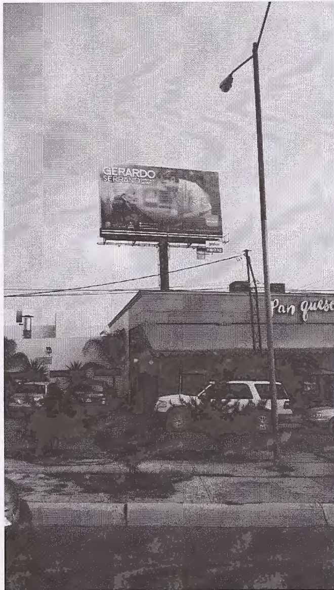
Archivo denominado "IMG-20161102-WA0004"