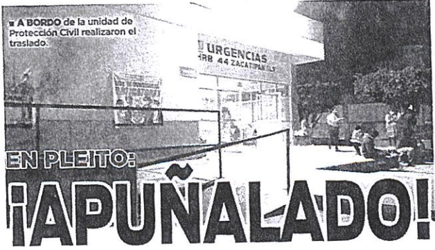
A BORDO de la unidad de Protección Civil realizaron el traslado.