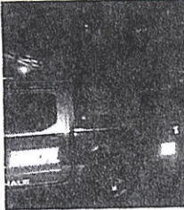
EL INFRACTOR quedó en las barandillas por faltas administrativas.