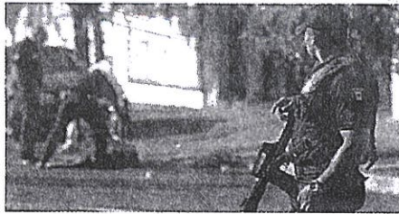
DIVERSOS HECHOS sanguinarios ocurrieron en las cuatro regiones de la entidad.

PASE DE PÁG. 14 Jueves 31 de Diciembre del 2020 www.diariozm.com RIOVERDE S.L.P.