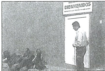
GENEROSO. El sacerdote será recordado por ver por el bien de los demás. (SLH)

La misa se desarrollará este martes en el templo de San José con cenizas presentes y el establecimiento de estrictas medidas de seguridad sanitaria y por ahora valoraban hasta entrada la noche si era necesario transmitirla a través de redes sociales.