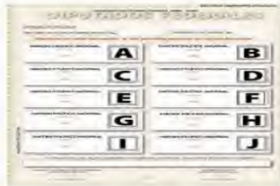
a) Aquel expresado por un elector en una boleta que depositó en la urna, sin haber marcado ningún cuadro que contenga el emblema de un partido político.