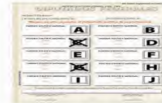
b) Cuando el elector marque toda la boleta o dos o más cuadros en la boleta sin existir coalición entre los partidos cuyos emblemas hayan sido marcados.